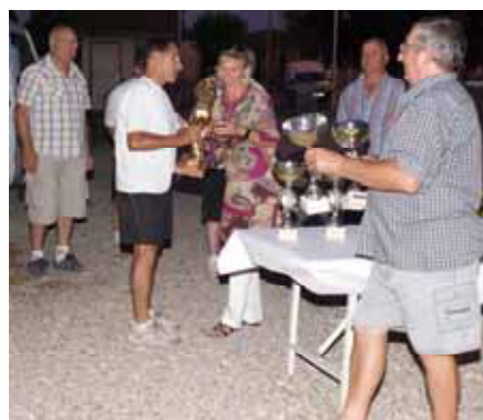
La remise du challenge