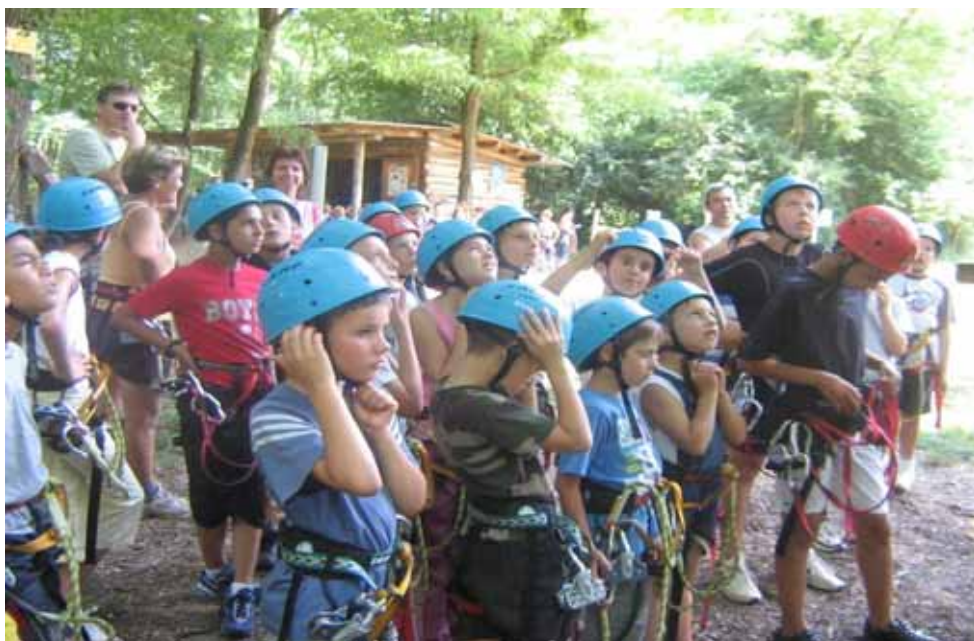
Enfants à la sortie accrobranches du 1er juillet.