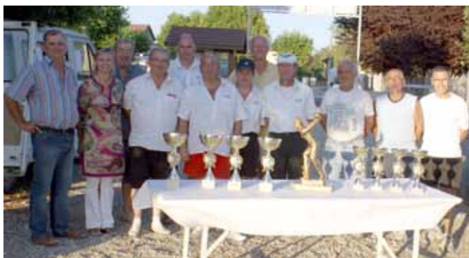
Les finalistes de l'édition 2009